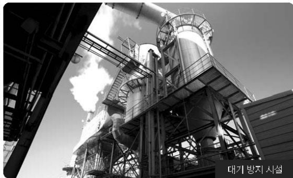
대기 방지 시설

EG메탈은 환경에 대한 관심고조와 함께 석유화학공정 중에서 발생되는 탈황폐촉매 처리를 통한 유기금속인 바나듐(V), 몰리브덴(Mo)을 추출하여 버려지는 자원의 재활용에 앞장서고 있는 리사이클링 전문 및 금속 소재 중심의 기업입니다. 2006년 유기금속 회수공장을 울산에 준공함으로써 금속소재 국산화 및 산업폐자원의 재활용을 통해 전량 수입에 의존하고 있는 유기금속