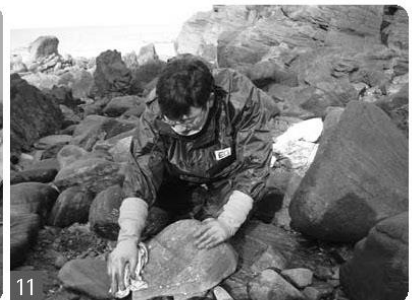
6/7. 도배공사 활동 8/9/10/11. 자연정화 활동