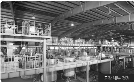
공장 내부 전경